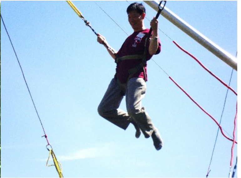
Bungee - 大小孩，其寬