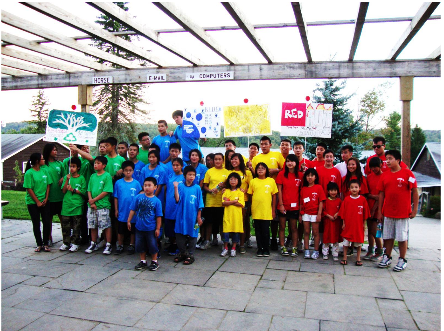
Four Teams & Banners