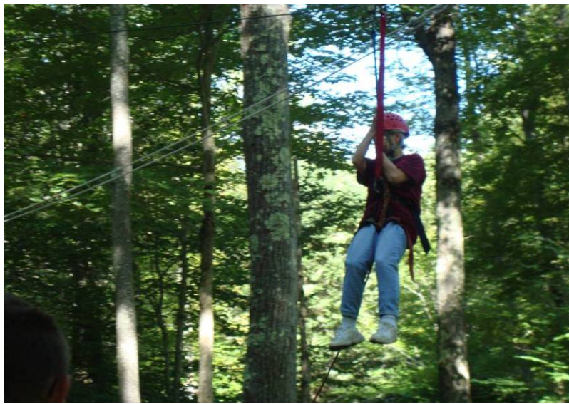
Zip Line - 明慧