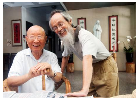
老賈.小區 老友相見歡