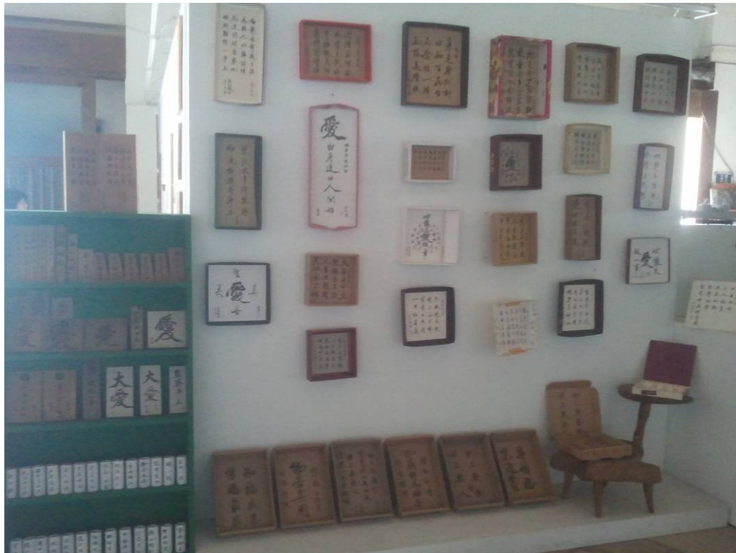
地點在舊花蓮港邊的倉庫改建的維納斯藝廊。非常有氣氛。 所有的媒材都是回收再利用的。