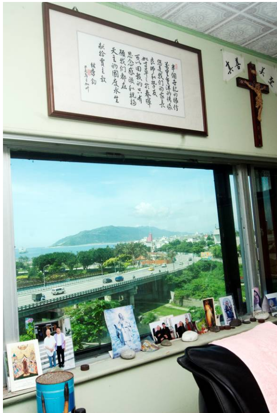
賈主教案前的風景

今年 2011 七月 15 日星期五上午 10:00 將於花蓮保祿牧靈中心舉行賈主教晉鐸六十周年感恩彌撒，歡迎大家來參加！