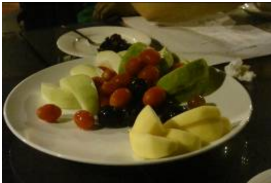
歐校長的擺盤. 將最美好的自己獻上