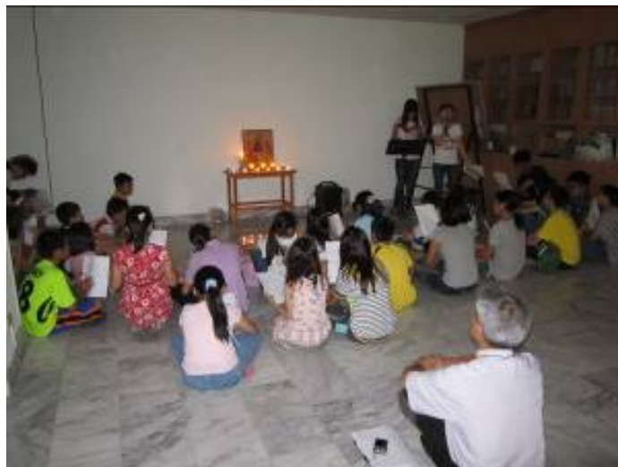
圖右上二為永仁之女在吹長笛伴奏(現唸成大交管二)