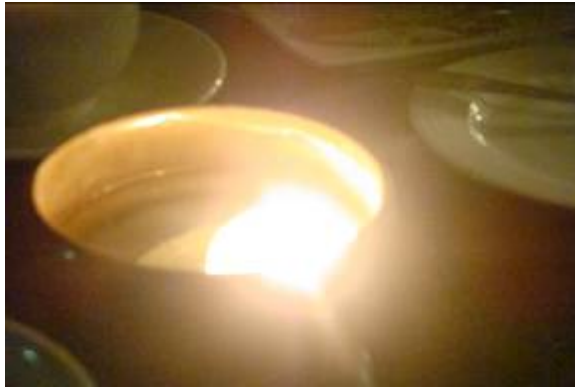
燈光美、氣氛佳、天主聖神同在