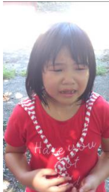
手手被不知名的蟲蟲咬到了！