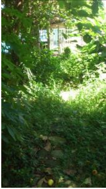
苔痕上階綠（往靜心室的路）