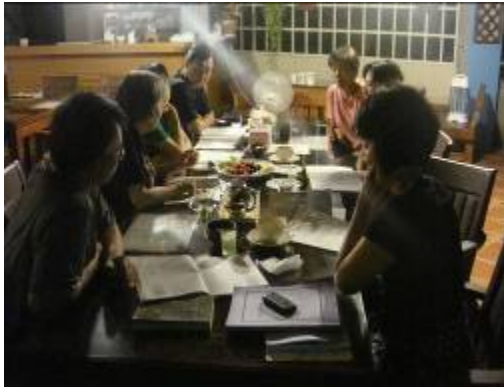
東分團祈禱小組在歐校長家