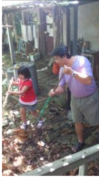
恭榮帶女兒們打掃