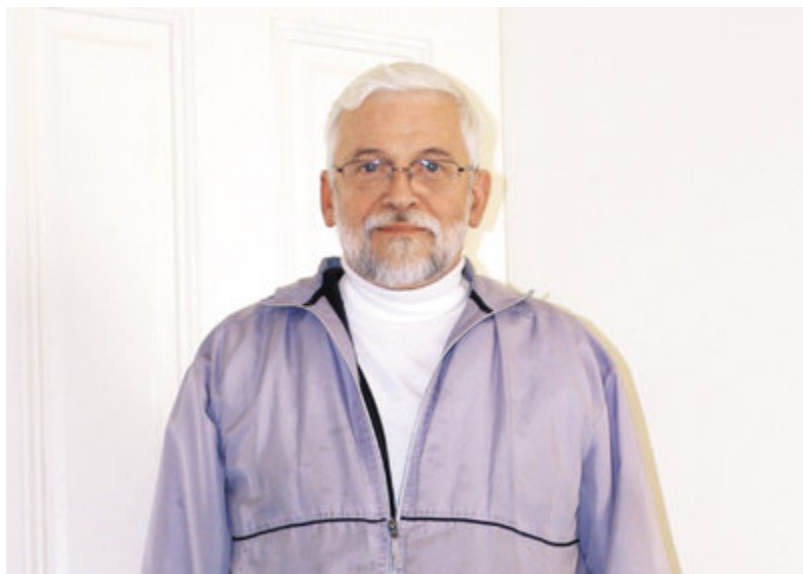
中文流利的滿而溢神父，致力於中美天主教交流與服務。