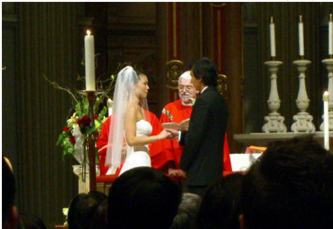
滿而溢神父為新人證婚。