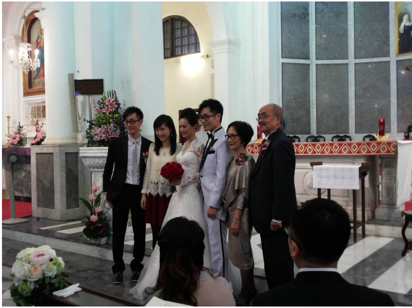
霍家六口，喜氣洋洋。