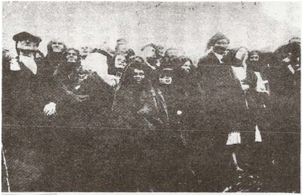
1917年10月13日日光奇跡之目睹證人。 4