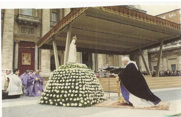
In Rome, before the statue of Our Lady of Fatima, Pope John Paul II with all the bishops of the church, renewed the consecration of the world and Russia (25th March, 1984) 17