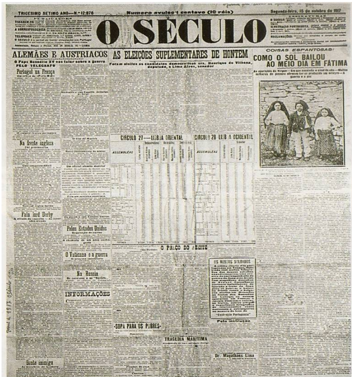
The daily newspaper O Século , for 15.10.1917, published for the first time a photograph of the little shepherds broadcasting the news of the 'Miracle of the Sun' throughout the country