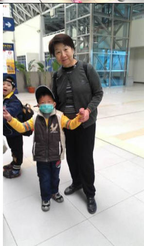
太長與巧玲送小朋友走向台鐵新烏日站