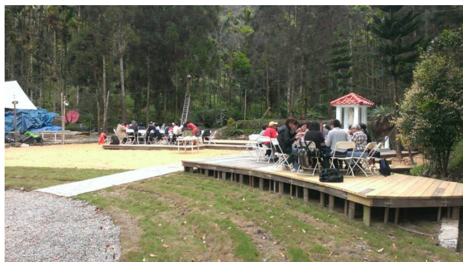
聖母亭旁露天午餐，五桌，每桌八菜一湯