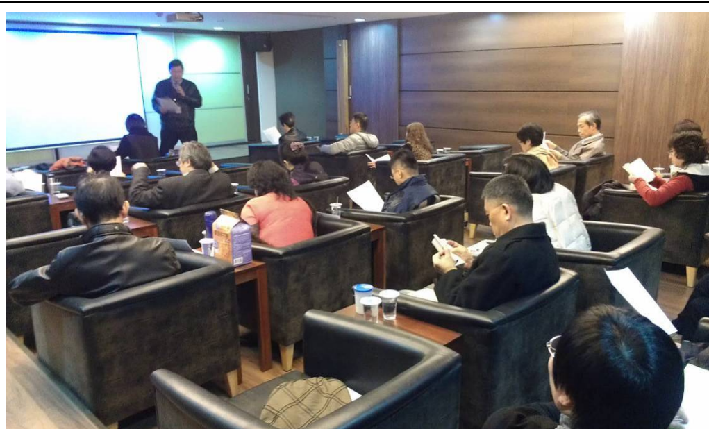
海鵬說明團章修訂