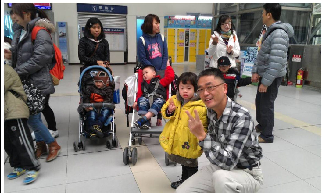
憲維與漢璽照顧情況