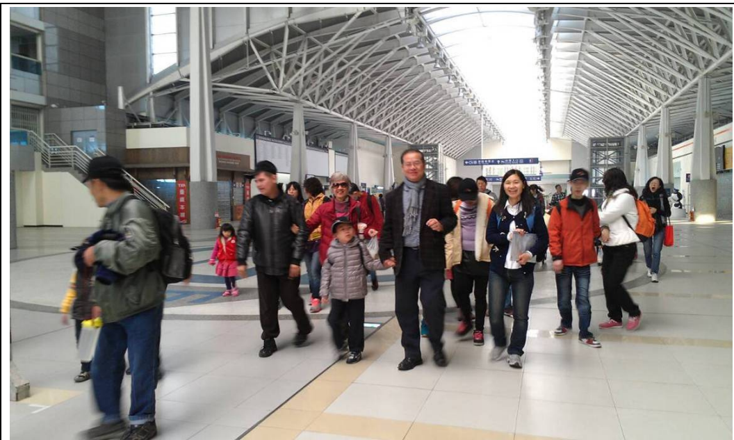
從台鐵新烏日站出來