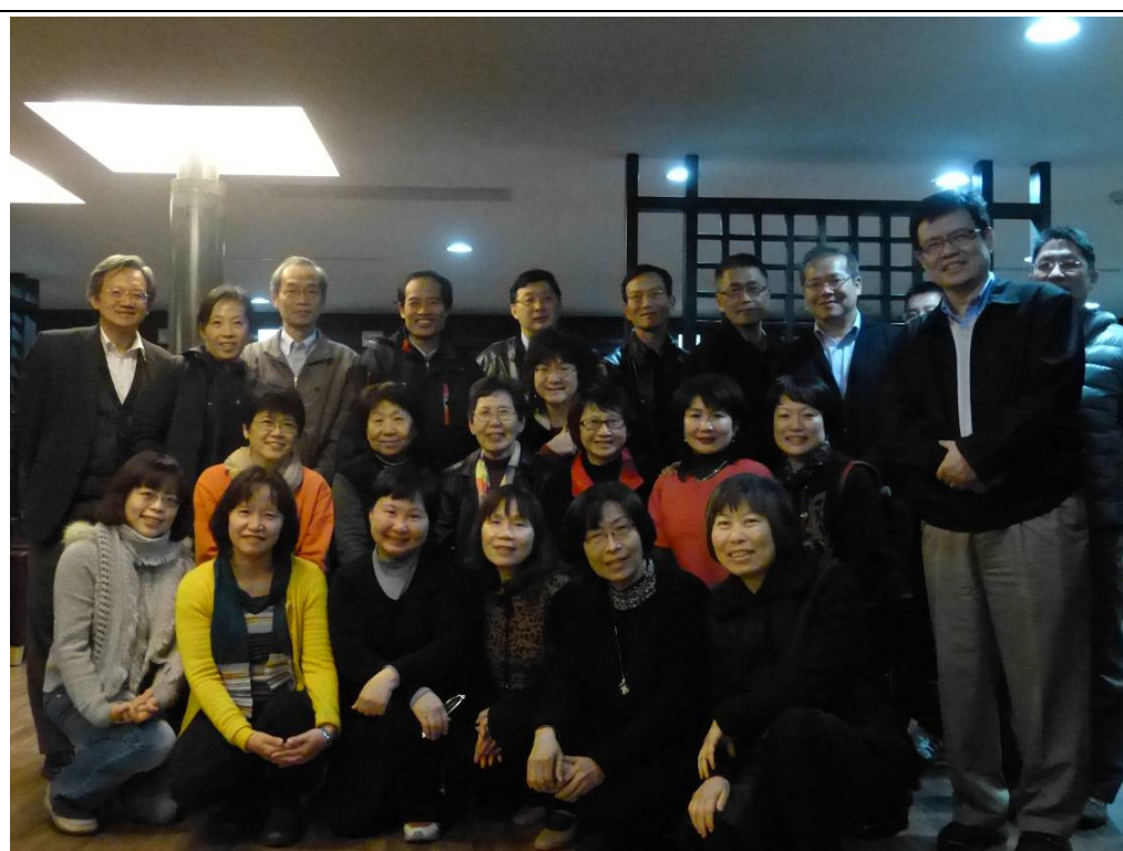
素玲姐演講完後明月講堂合照