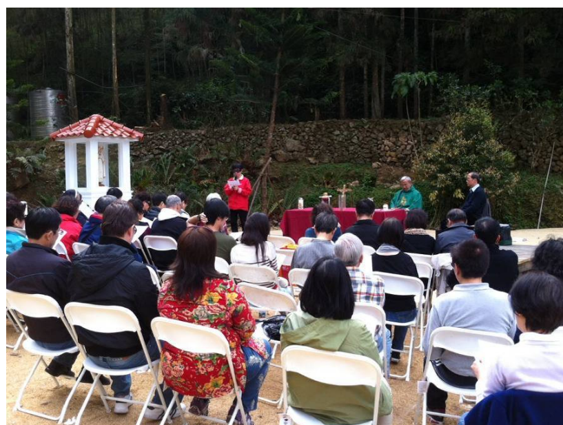
聖母亭旁露天彌撒