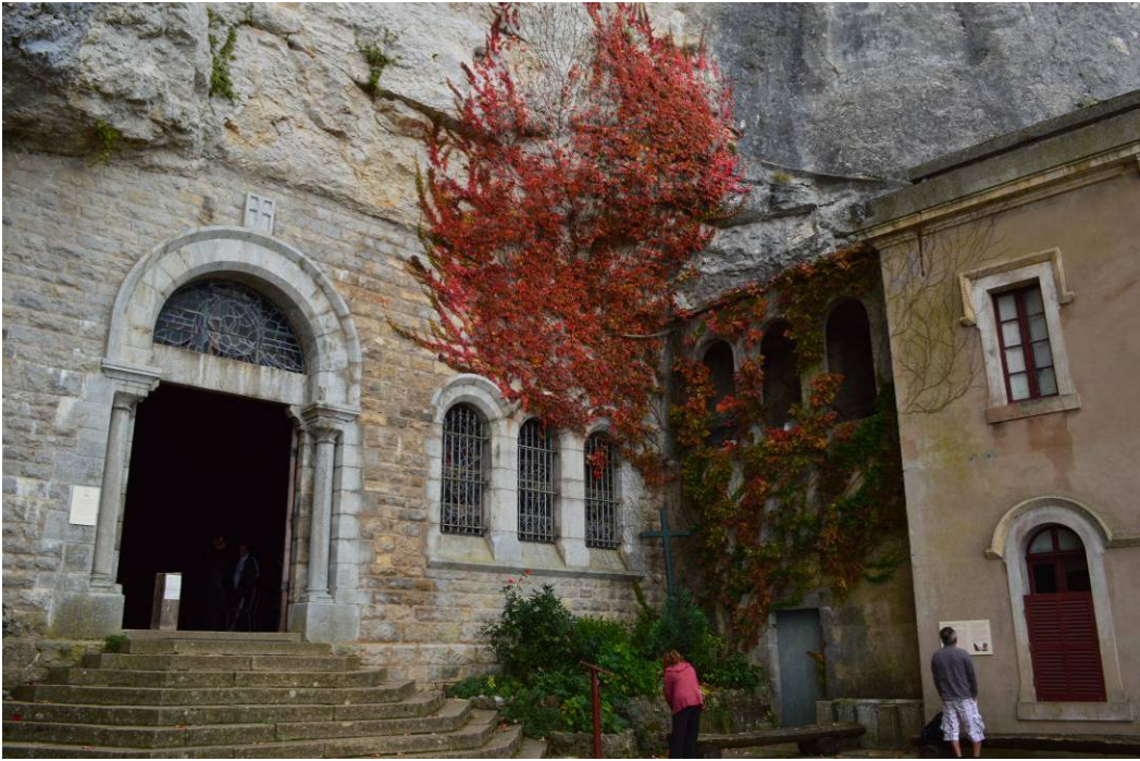
照片 2: 山洞的入口