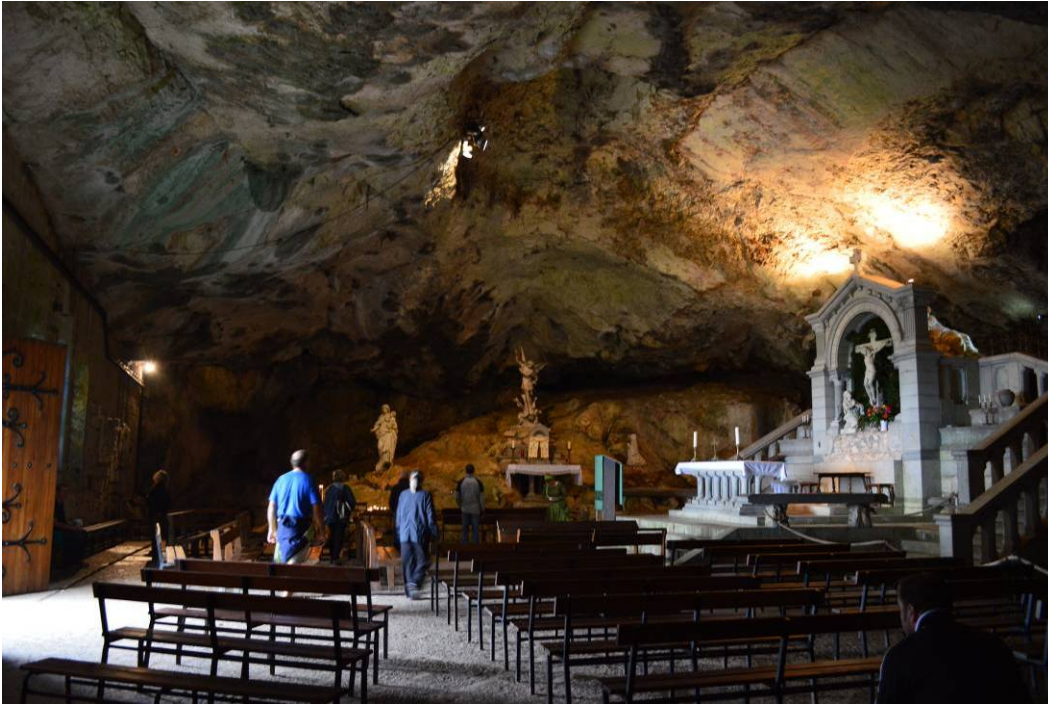
照片 3: 洞内的小教堂