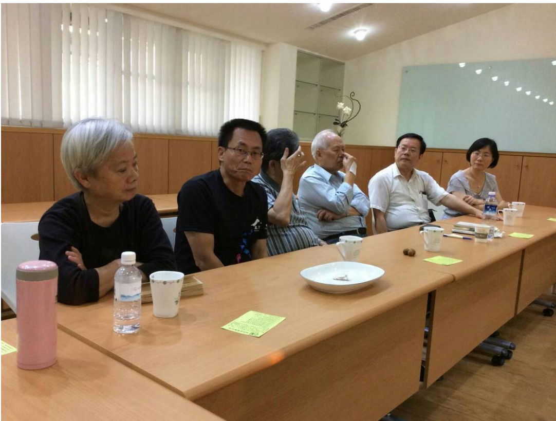
【豫台分享總團大會結束以來，真福山的發展近況】