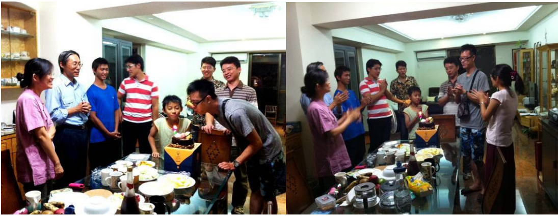
【兩位壽星熱情有力吹蠟燭】