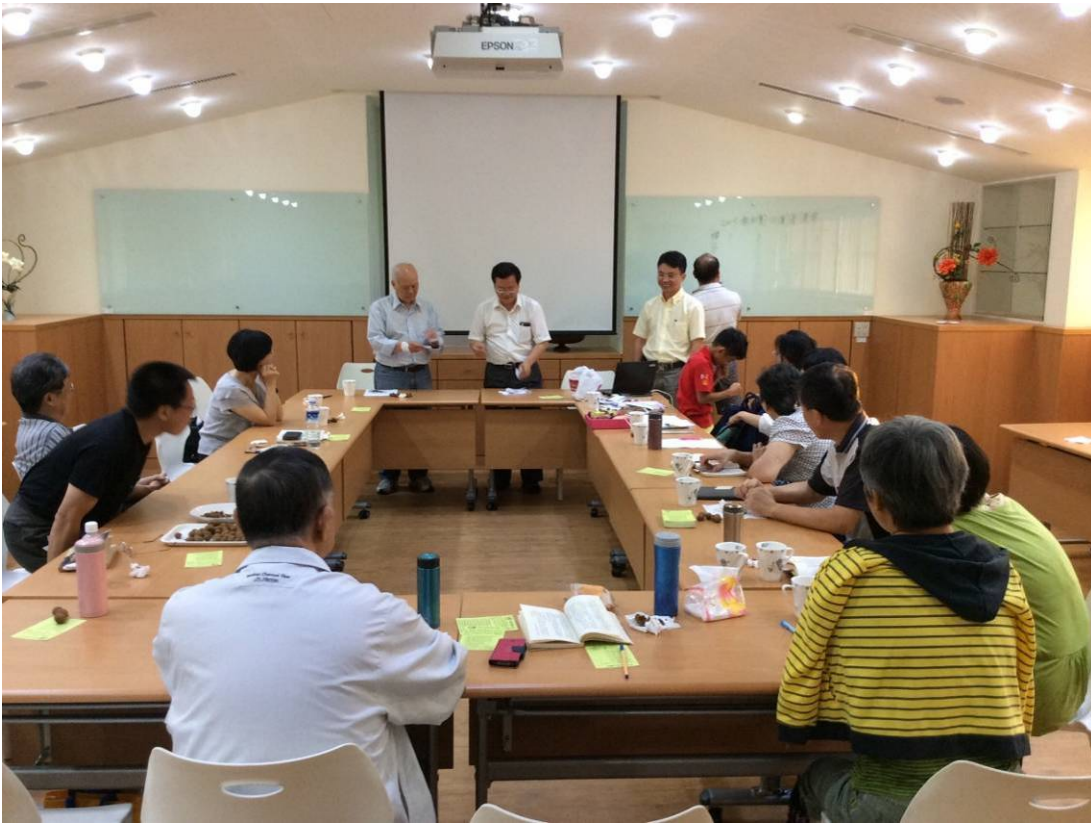
【改選分團長，煞有其事的開票作業：立言唱票、發熹監票、存真計票】