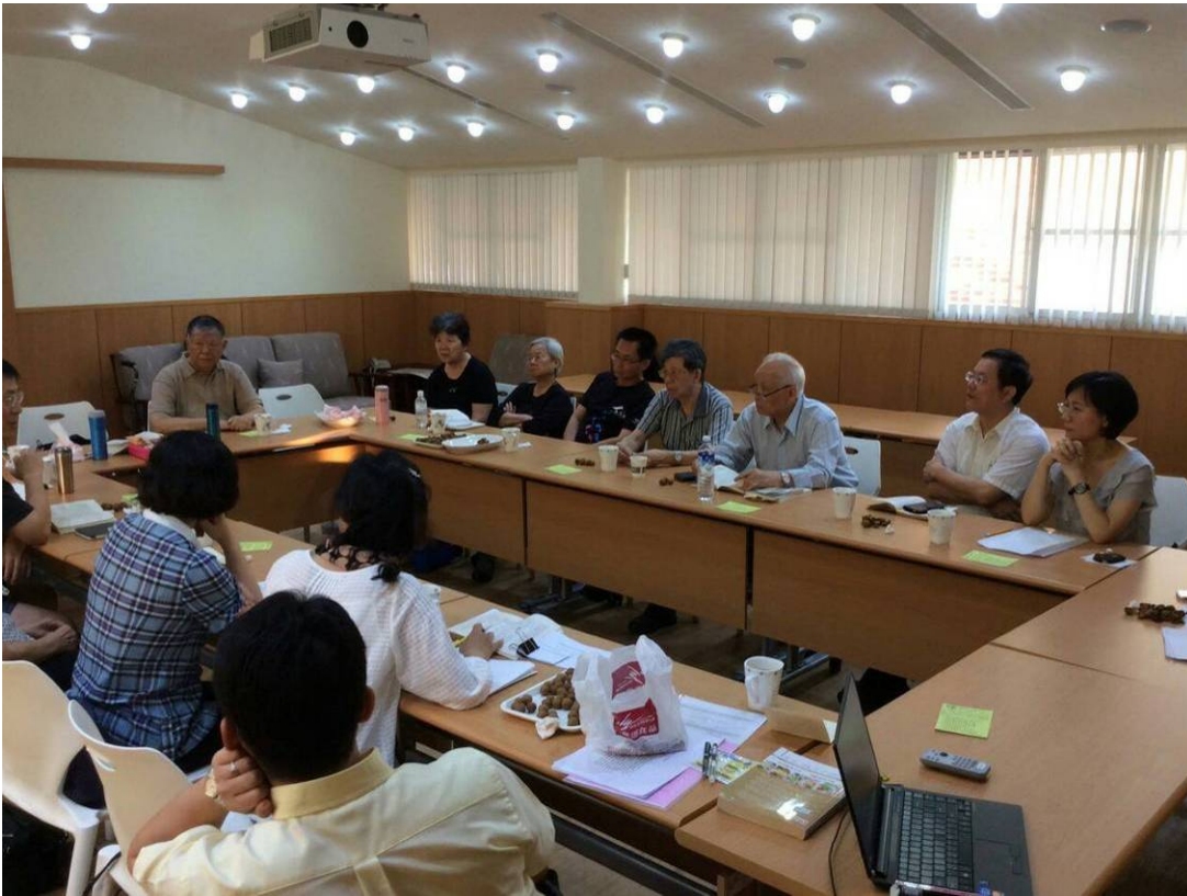
【團員們就每一講的主題分享個人心得與經驗】