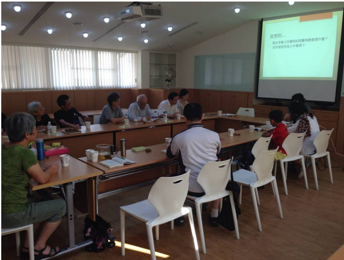
【惠敏與憶蘇帶領大家研讀、分享大風道理集第三、四講】