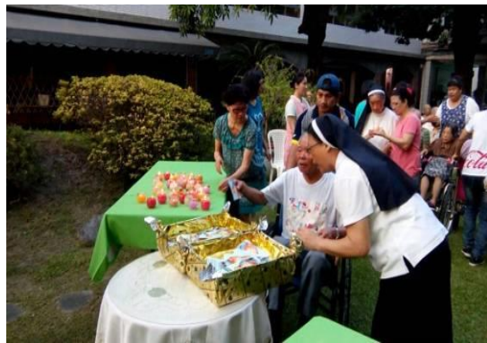
【每位長者奉獻蠟燭】