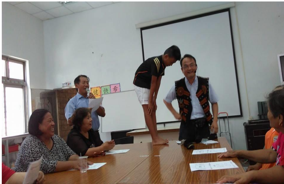
【泰武鄉佳平村健康講座現場】