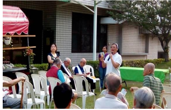
【六月六日於中庭舉行耶穌聖心敬禮】