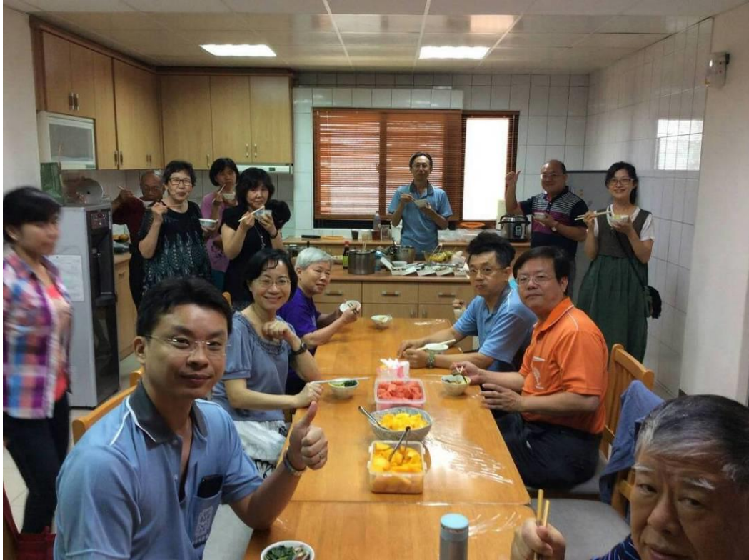
【月會、端午佳節共融】