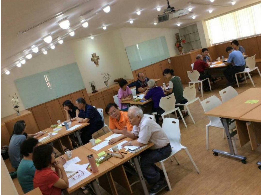
【四人一組分享大風道理集】