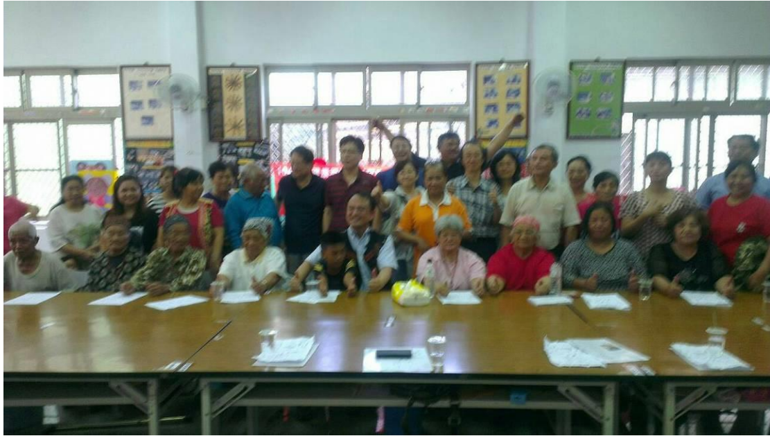
【健康講座全體合影】