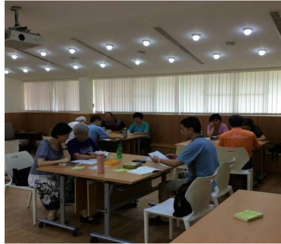
【你講我聽、我講你聽】