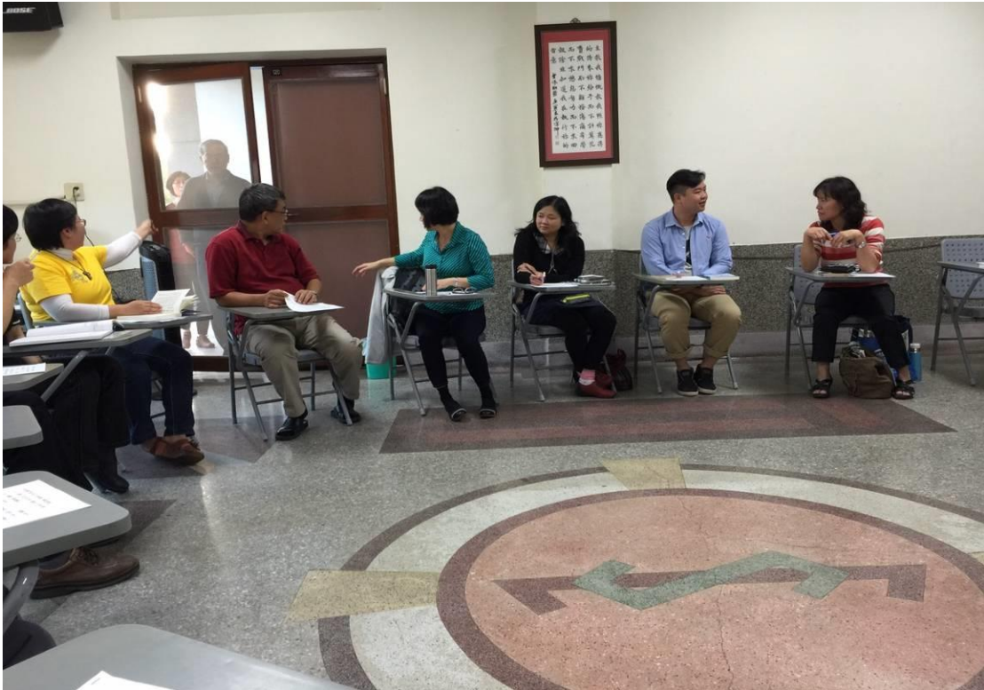
2015年12月13日於彰化靜山召開12月份月例會