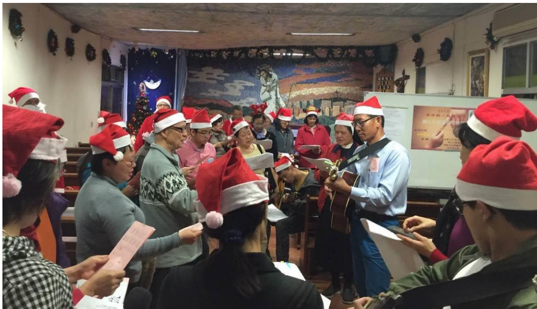
2015年12月22日於善牧堂行前練唱