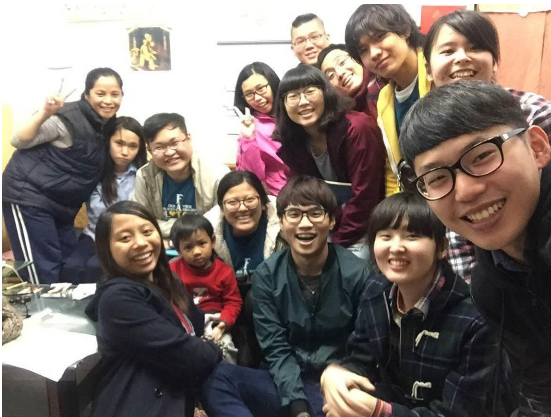
天主教大專同學會中區分會（東海大學、靜宜大學、逢甲大學等3校） 2015年12月21日到善牧堂教友家裡報佳音