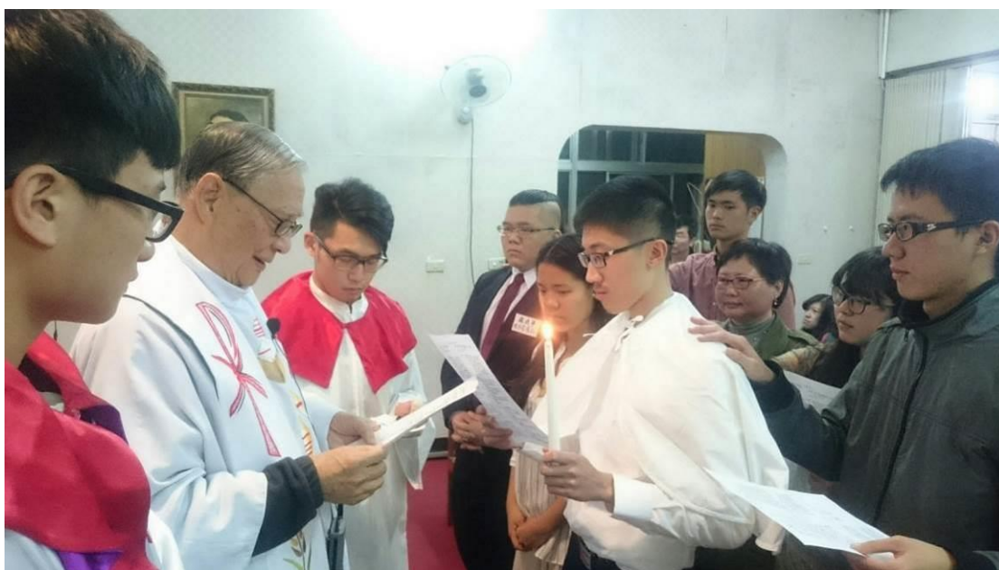
中區大專同學會復活節元劬領洗暨志瑜、建寧堅振聖事