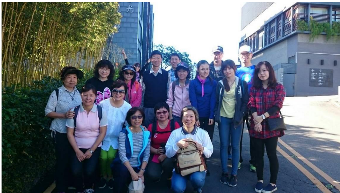
2月13日大年初六大坑健體活動