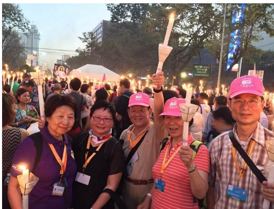
1月28日在菲律賓宿霧參加聖體遊行