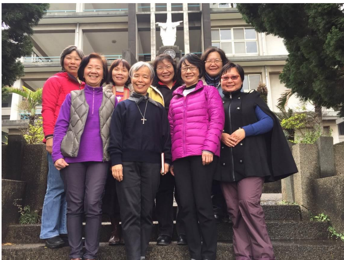
3月11日至13日四旬期在彰化靜山舉辦團體避靜