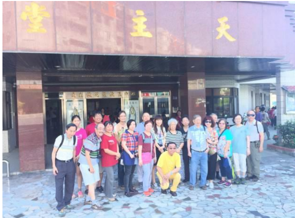
彌撒後與多位服務團兄弟姊妹合照