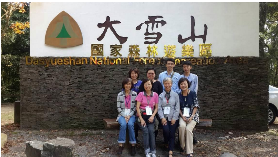
圖 4、2016 年團慶在大雪山國家森林遊樂區舉行