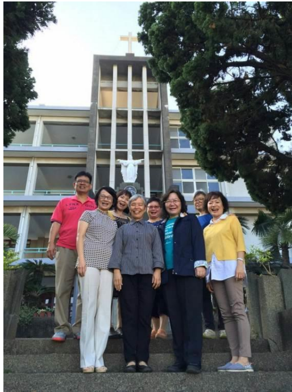
圖 3、中分團團體避靜出靜後合影