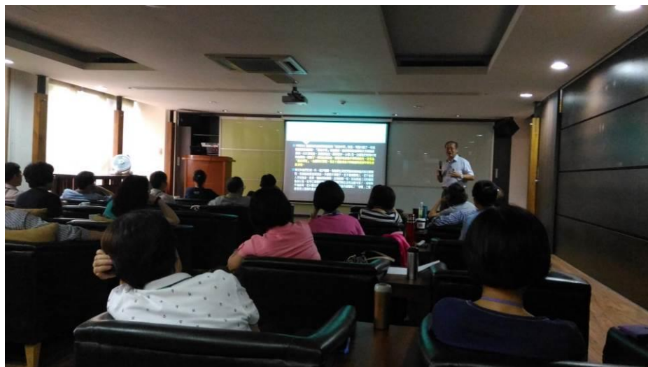
圖 1、10 月份大風營