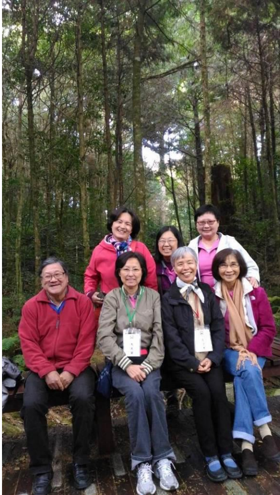
圖 5、團慶在《森林浴步道》留影