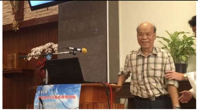
105.8.13 醫師確診後主日彌撒為教友做信仰分享，和教友們告別。