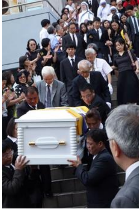
在 De Colores ! 歌聲歡送下與大家道別