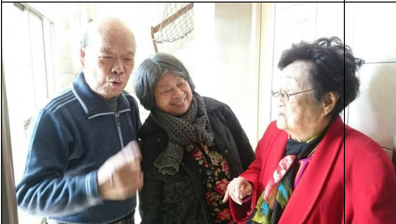
爸媽和胡媽媽是多年好友，互相激勵