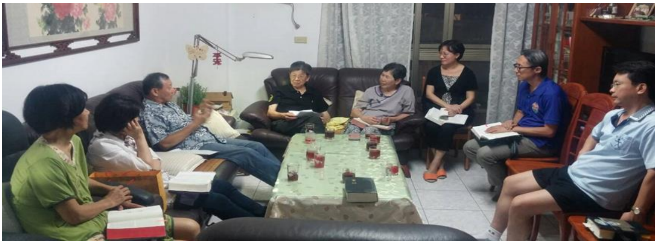
十一月在健原、健安家讀經