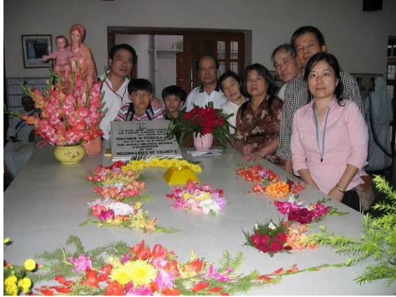
2004 全家到印度加爾各答德肋莎姆姆母院