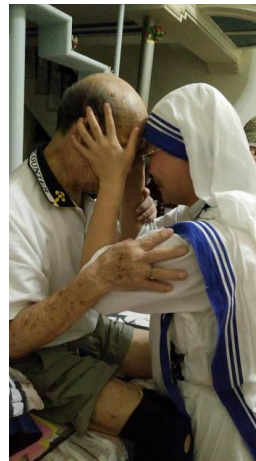
105.10.4 玉君返回柬埔寨和爸爸訣別，天國再見。