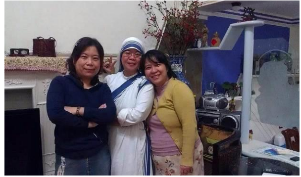
爸爸為三個女兒拍的照片