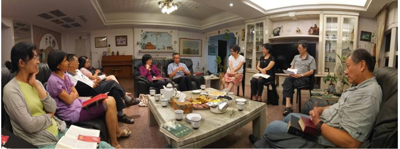
十月在文聲、素玲家讀經