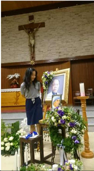
學藝術的外孫女為阿公的遺像畫