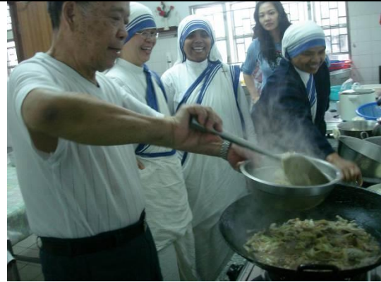
在澳門會院大顯身手