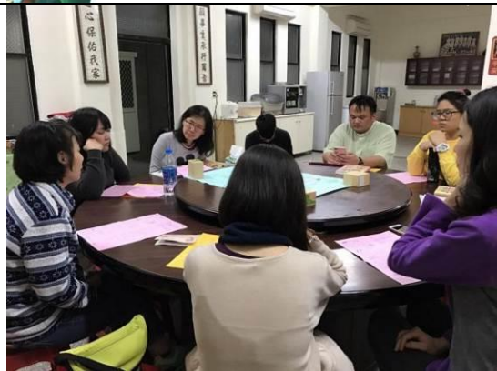
青年工作一定要續攤吃宵夜啊