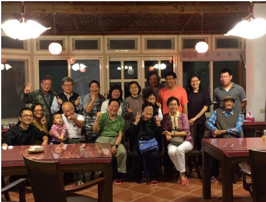
在生日快樂莊園相聚：有生之日都快樂！！！！