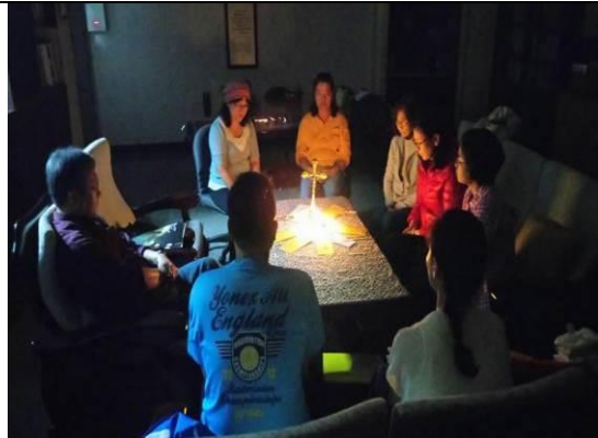
光在黑暗中照耀/我們渴望寬恕和好