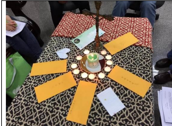
寫給耶穌的一封信