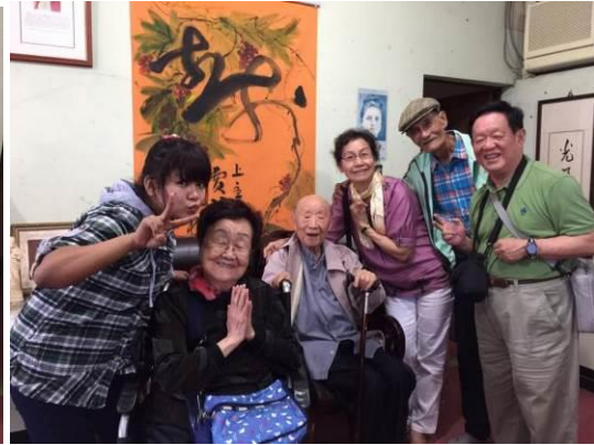
僑榮大哥與胡媽媽來訪，喜樂的共融