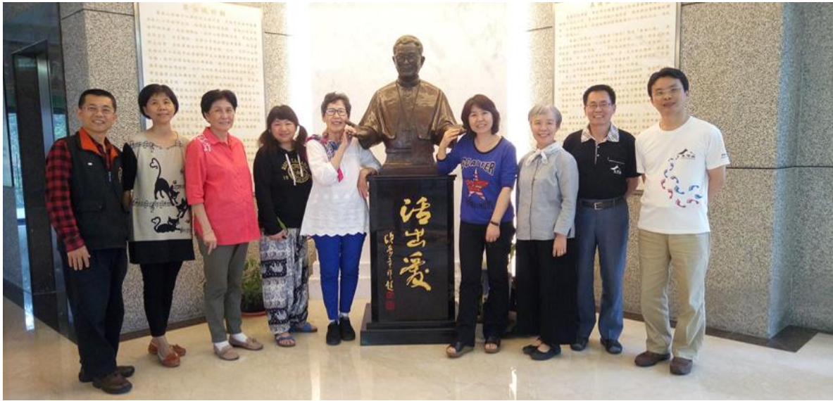
(這張少了伯陶，多了豫台)