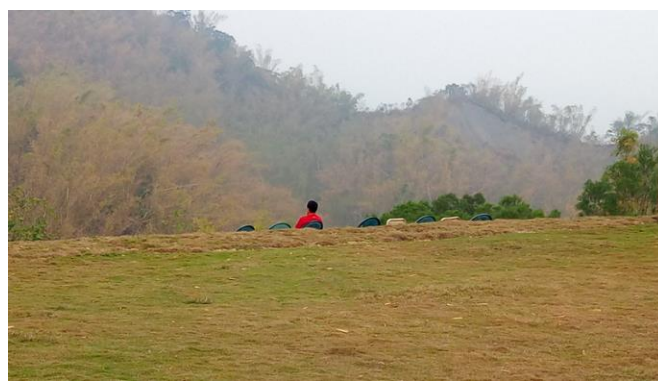
(避靜中的哲人身影—耀堂)