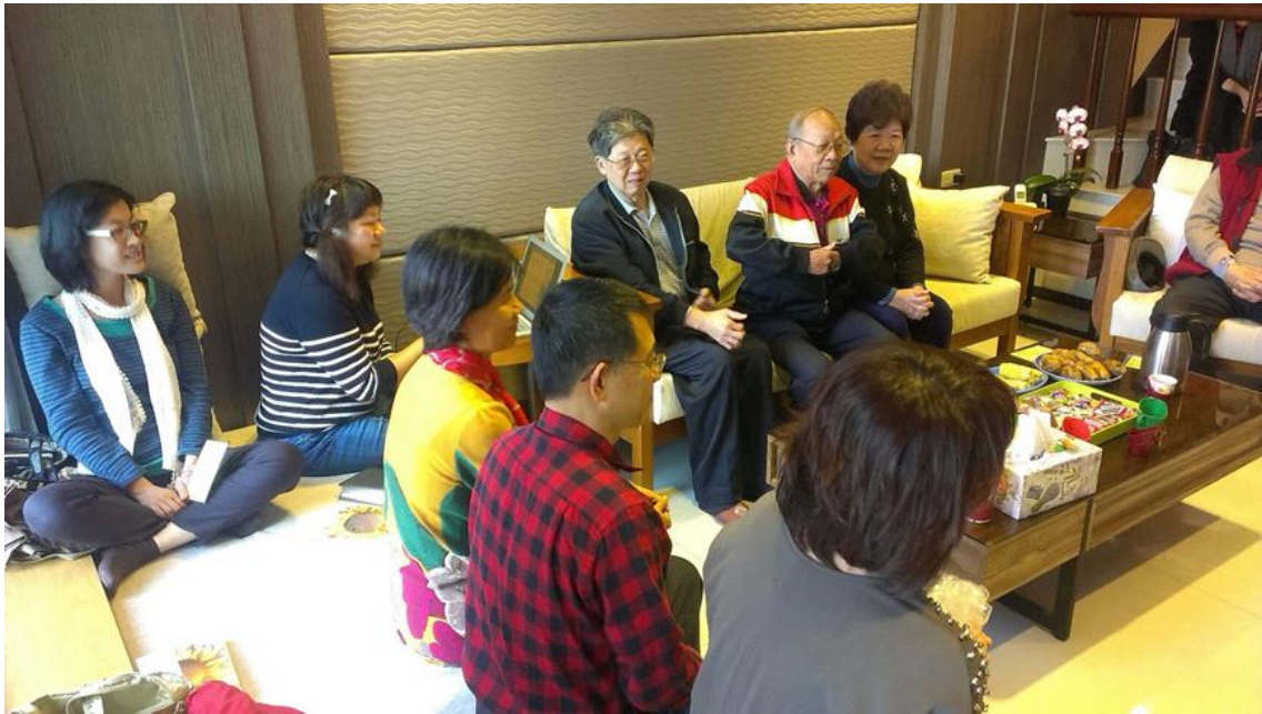
(元章、家群、文聲、德芳、心怡、健安、健原、憶蘇)