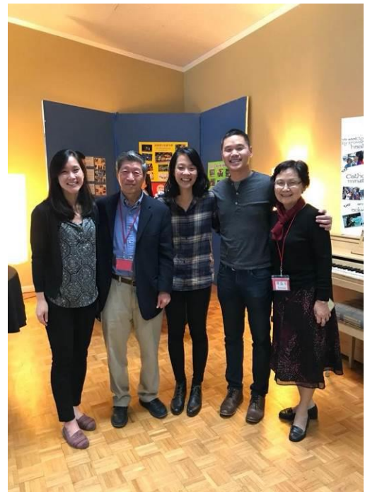
鴻業、盛芳與女兒、兒子、媳婦