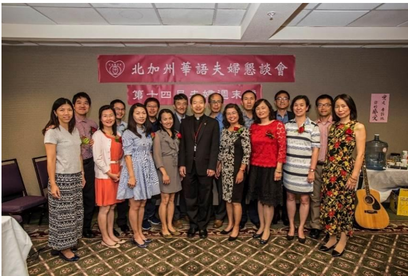
第十四屆週末營學員夫婦們

這次參加的八對夫婦中，五對都是年輕的夫婦，有一對還沒有孩子，其他四對年輕夫婦共有七個孩子(四歲到十三歲)。這給我們很大的鼓舞，愈早參加週末營就愈早對夫妻關係和諧有益，對孩子和家庭也有很大的好處。