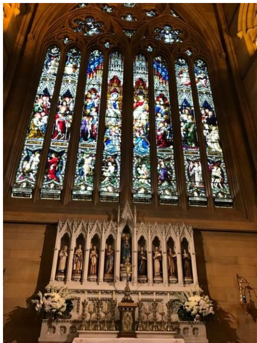
St Mary's Cathedral, Sydney, AU

清晨到達澳洲雪梨，就在市中心把行李託給船上，在市內各處走動，手機成為我們的導遊。第一目標就是主教座堂St Mary's Cathedral。英國哥德式建築，很傳統，很像歐洲的精美大教堂。相較之下，雪梨歌劇院除了造型耀眼，建築太簡單粗糙了。