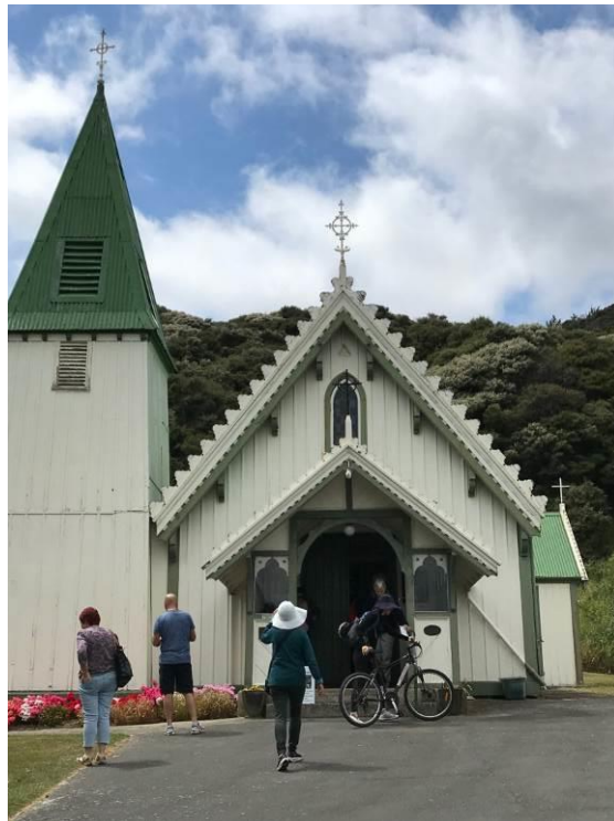
St Patrick's Catholic Church, Akaroa, NZ

印象最深刻的是這位主禮的年輕神父，彌撒崇拜莊重，道理清楚生動，對待信友輕鬆自然安詳，明顯和天主關係良好。