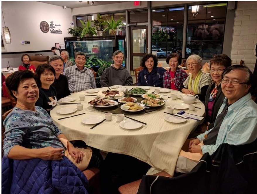
歡迎區團長夫婦來南加聚餐