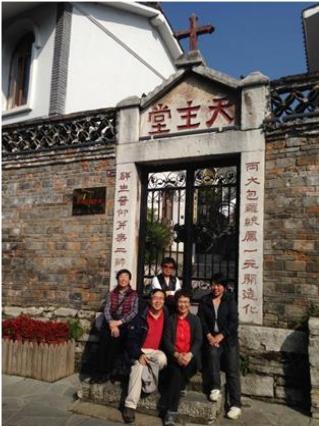
和修女們合影於青岩天主教堂大門