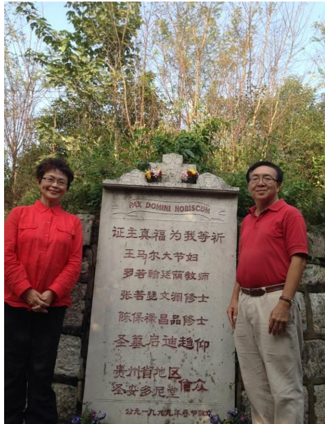
貴州青岩中華聖人為我等祈