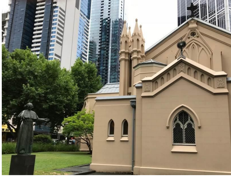
St Francis' Church, Melbourne, AU

在澳洲和紐西蘭，天主教Roman Catholic和英國國教Anglican關係很好，雙方都有合一精神。教宗若望保祿二世還在1986年歷史性訪問過墨爾本的Anglican主教座堂St Paul's Cathedral！