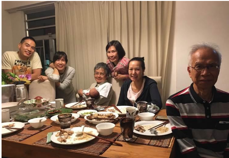
關家之大小姐、二小姐、公子、媳婦及孫兒

劇、或講笑話的表演。油輪 11/30 出發，所到之地是 Falmouth, Jamaica, Cartagena, Bolivar, Gatun Lake, Colon, Archaeological Site of Panama Viejo, Panama City, Limon, Costa Rica, Caribbean Sea, Grand Cayman, Cayman Islands , 再回 Fort Lauderdale- Harbor Beach，各個旅遊區賣的紀念品幾乎都是中國製造的。