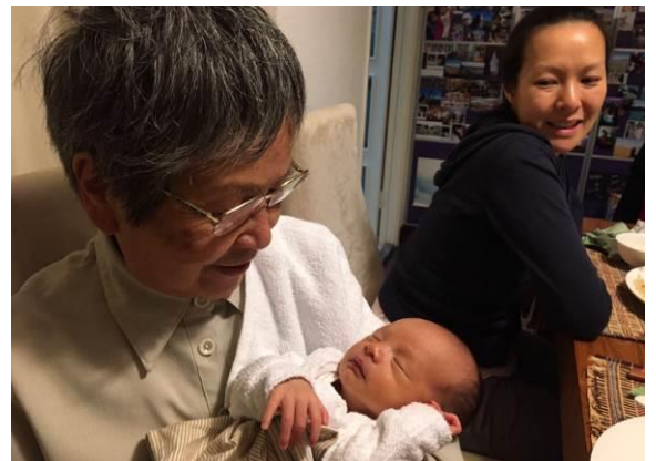
西華抱著乖孫關至仁，旁為乖孫的媽媽

三年多前結婚的兒子，十一月二十九日喜獲麟兒，他工作的花旗銀行給兩個星期有薪假日，媳婦任職 American Century Investment Management 給五個月有薪假期。他們聘請了專業陪月，另加兩位全職住家菲律賓姐姐，所以我每隔兩天去港島半山探訪孫子，沒有幫忙的機會，就只唱唱中國歌曲或昆曲給他聽。快四十年沒抱過小嬰兒，一抱就緊張，真的沒用。