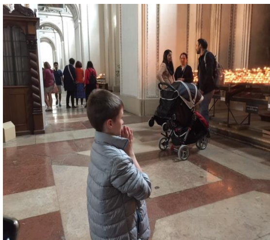
Salzburg Cathedral 遊人如織, 卻有位虔誠男孩.