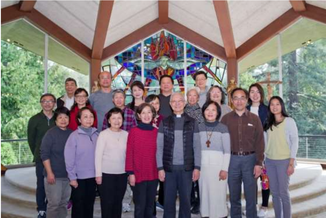
饒神父與參加將臨期避靜的團員合影