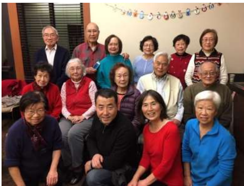
北加州東灣樂詩畝社區的天主教友合家歡