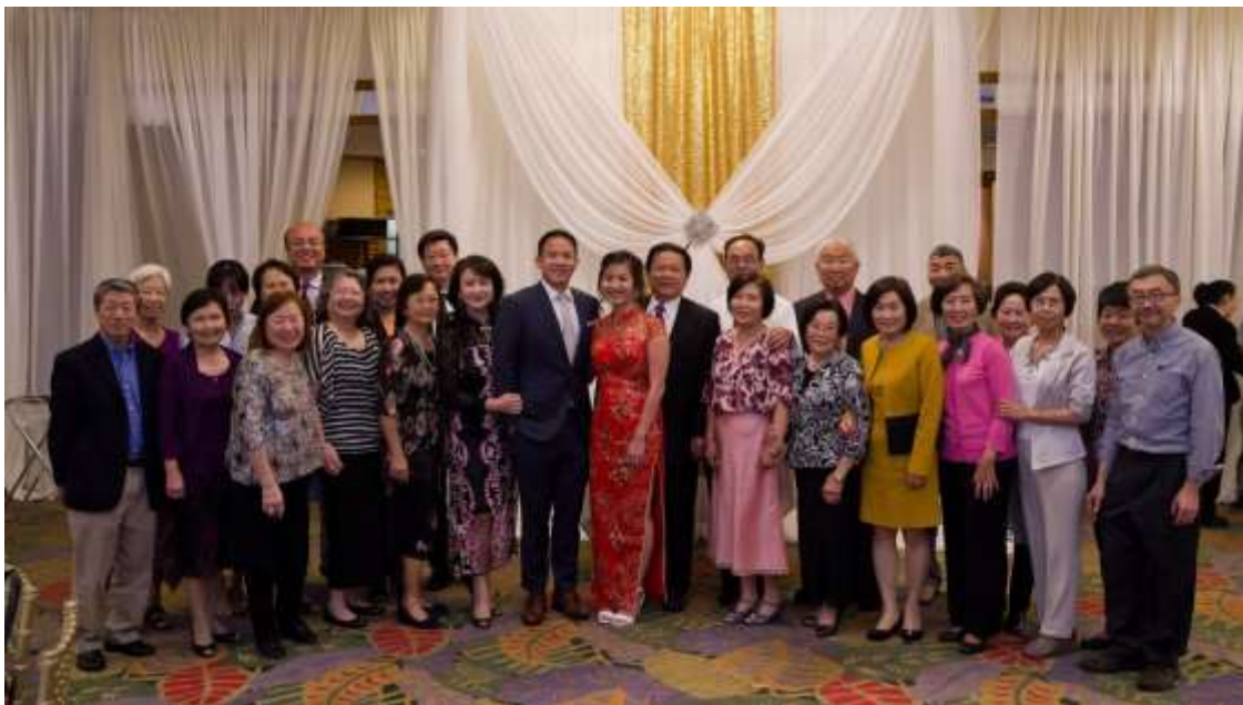
10月13日 樹治小兒子婚宴與團員合影