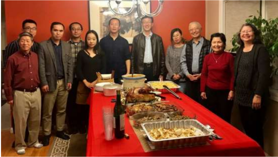
與輔友學人們共度感恩節