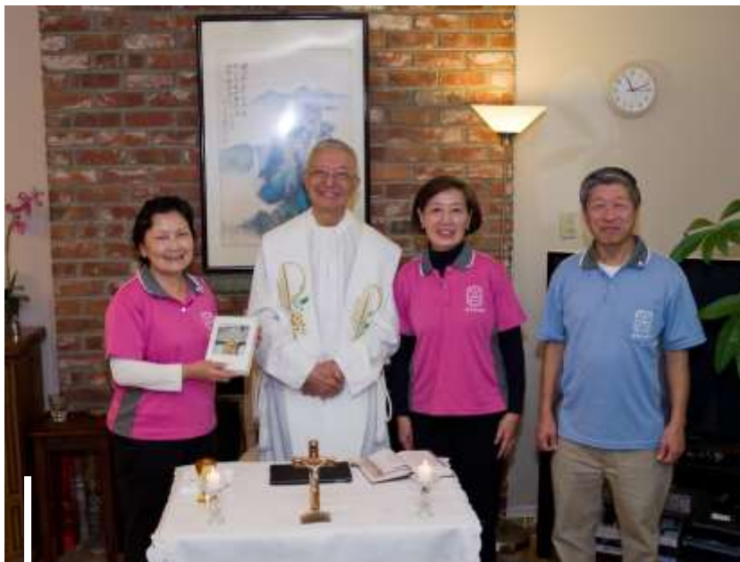
美西北分團長交接 (盛芳、饒神父、凱雯、鴻業)