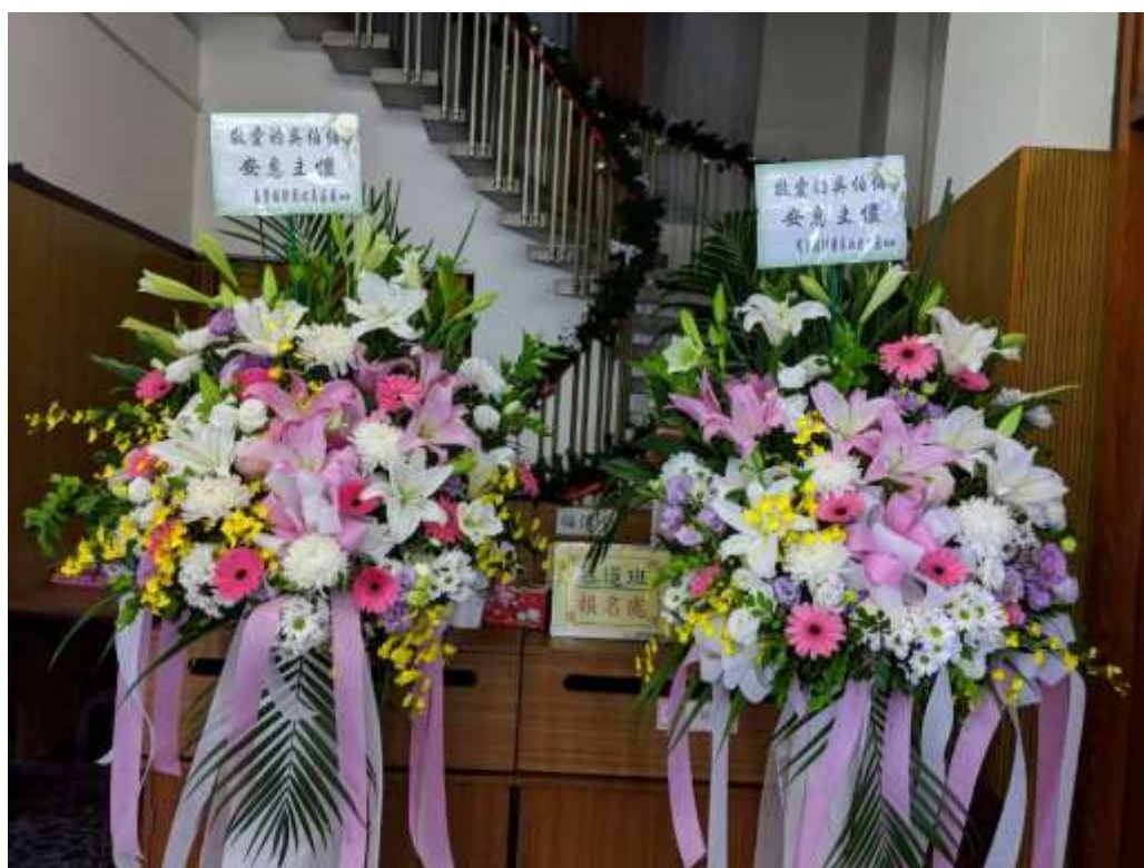
吳伯伯殯葬彌撒北美區團美西北分團致送花圈悼念