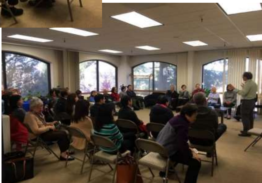
甘神父的靈性關懷「講做」： 神父「講」，參與者「做」