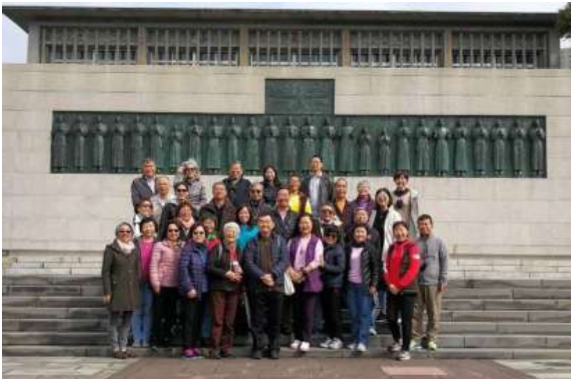
日本朝聖 在長崎廿六聖人殉道碑前

「準備好了嗎？」是否真正了解天主教的價值觀和天主要我們去做的事情？雖然這是一次很沈重的朝聖之旅，時時都引人深思反省，但是大家都收穫匪淺。