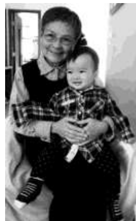
西華與乖孫關至仁