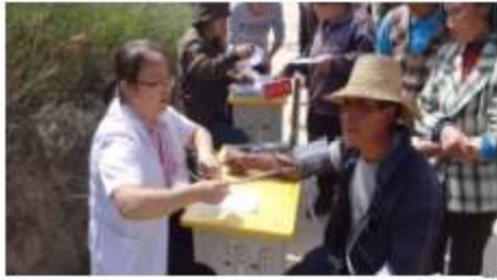
蘭州社會服務舉辦農村義