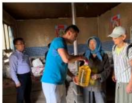
蘭州金城社會服務中心探訪弱勢家庭