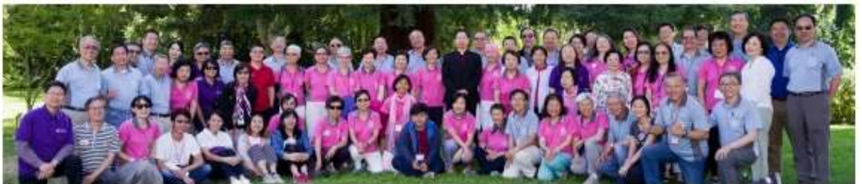
6/28-30/2019 北美區團年會和北美仁愛基金工作坊