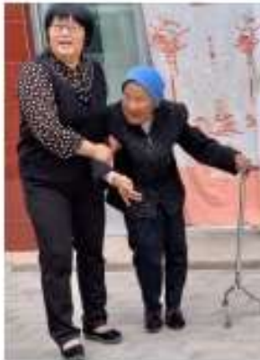
孤兒院裡年紀 最大的孤兒