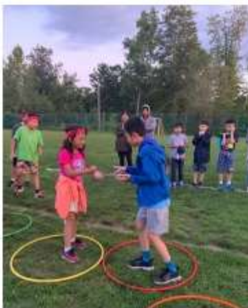
大紐約區華青夏令營