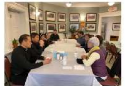
探訪康州留學神職修女