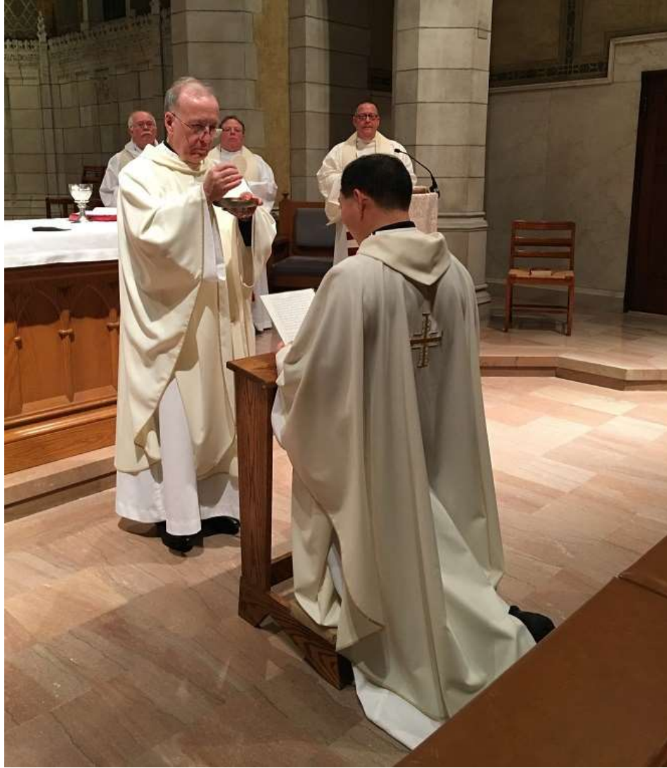
2/15/2020 姜神父在耶穌會發末願大典