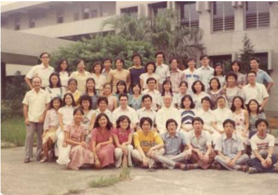
第八屆信仰生活月 1980 暑期於輔大神學院

祈主聆聽吾等禱聲，護佑大家平安、健康；祈聖母代世人轉求，使疫情早日平息，感謝天主、聖母！