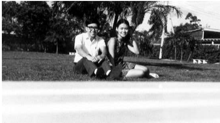
第一次約會於榮星花園（1971）