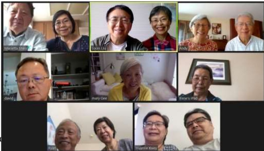
美西南分團 6/6 季會

我們家所屬的堂區在關閉三個月後於六月七日開放，但每台彌撒限於一百人，保持距離，並全程帶口罩。勇為和我屬於高危險族，所以我們繼續在網上望彌撒，六月十四日我們參與了一個非常特別的成人入門聖事，有三位領洗、五位初領聖體。自我有印象的這二三十年，我們堂區的成人入門聖事都是在復活前夕，受洗者是全身下到受洗池(內穿泳衣, 外罩咖啡色袍)，領洗後，去更衣換上白袍。記得 1999 年勇為領洗，在池中感動得流淚，除了本堂區的教友，我們一些親朋好友也都在場，帶來滿滿的祝福。今年入門聖事在六月十四日主日彌撒，領洗者只能邀請自己家人，全程帶口罩，保持距離，領洗是神父將水澆一些在額頭上，之後用自己從家帶去的白毛巾擦乾，再穿上白袍，我感謝天主，不斷地將祂的羊領回羊棧，希望明年復活節我們能親身在教堂參與彌撒，當面歡迎那些剛入門的兄弟姐妹。