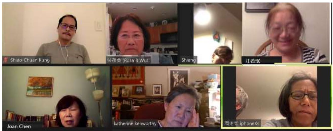
周日晚上玫瑰經視訊