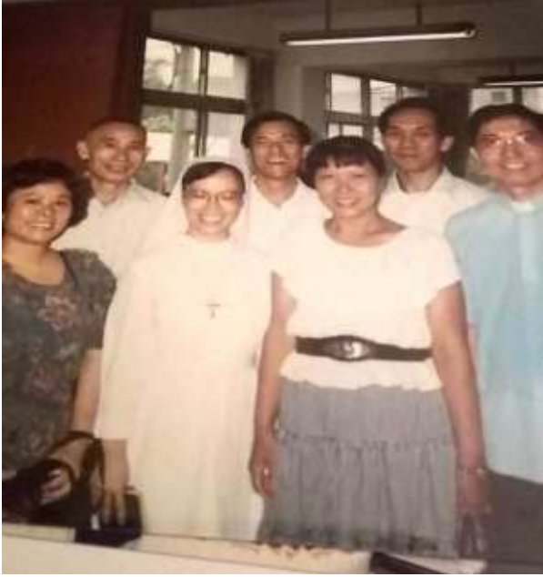
左一佩英姊