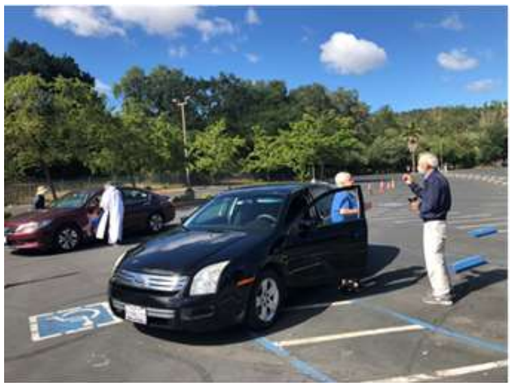
Rossmoor 教堂的神父在停車場為教友送聖體