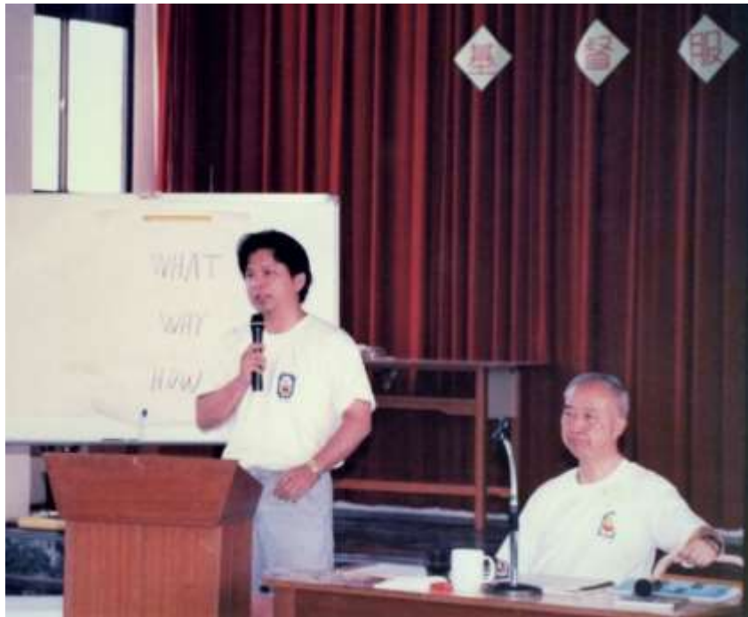
樹治剛入服務團的年輕照片