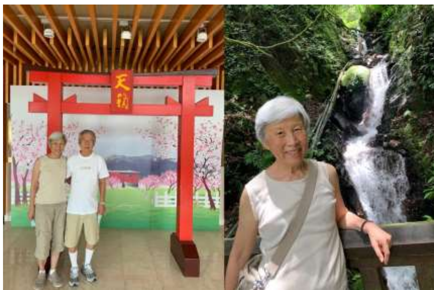
天籟渡假酒店與魚路古道中的瀑布

回想起來這些「充滿意外」的事，不都是天主特意的安排嗎？我又為何不用「滿懷驚喜」的心態去接受它呢？