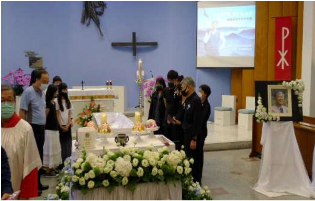
文瑞校長安眠於台北市慈恩園生命紀念館