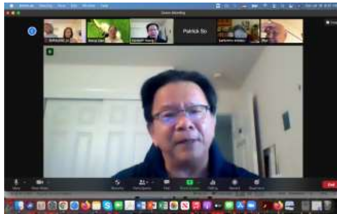
樹治總團長蒞臨與會

作者: William A. Barry and Robert G. Doherty