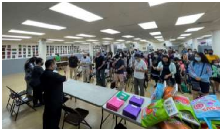
9月12日顯容堂學生家長會議，神父降福。