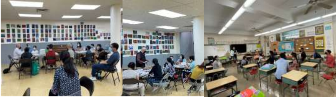
志工教師與學生及家長，說明溝通教學內容及課程規範。