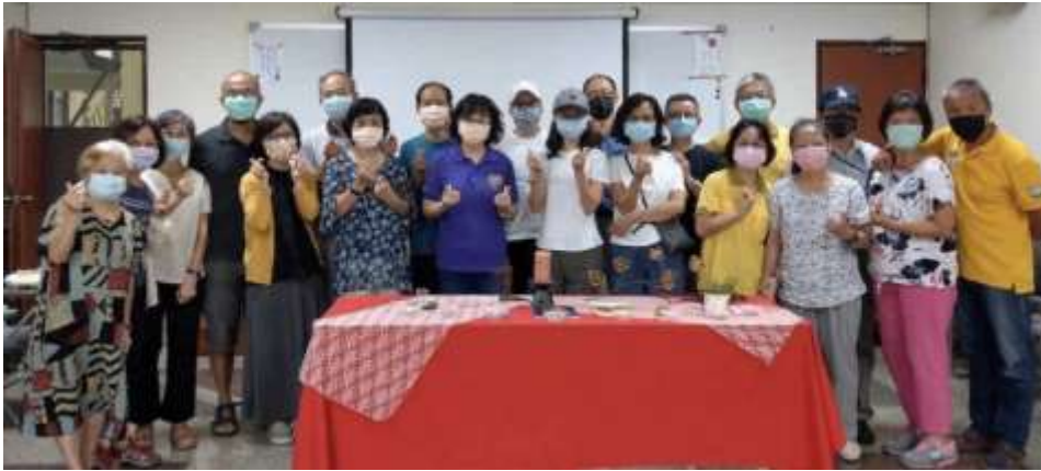
夫婦避靜的輔導與參與夫婦們