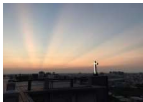
靜山的夕陽與頂樓的餘暉