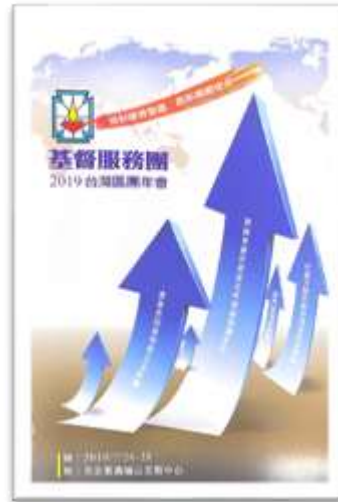
2019 年主題：面對變遷環境，創新團體使命