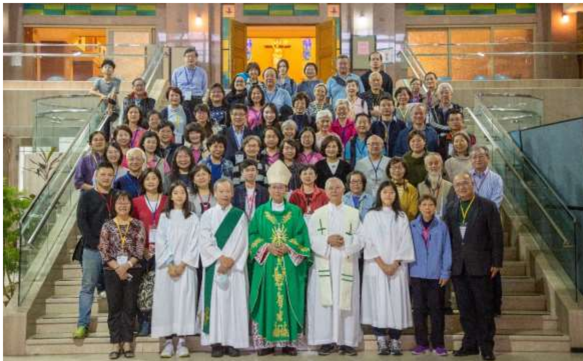
開幕彌撒後與鍾總主教合影