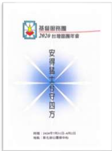
2020 年主題：安得猛士兮守四方