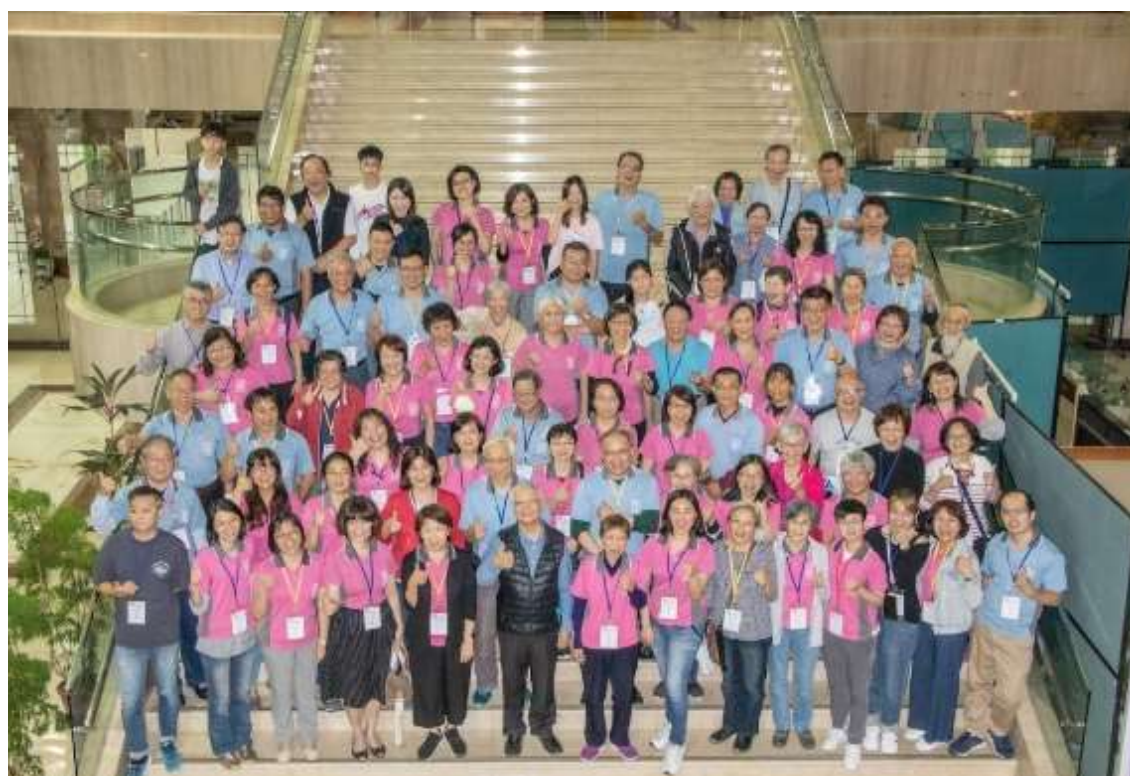
閉幕彌撒後大合照