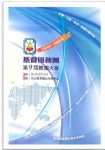
2018 年主題：大風再起，開創新局