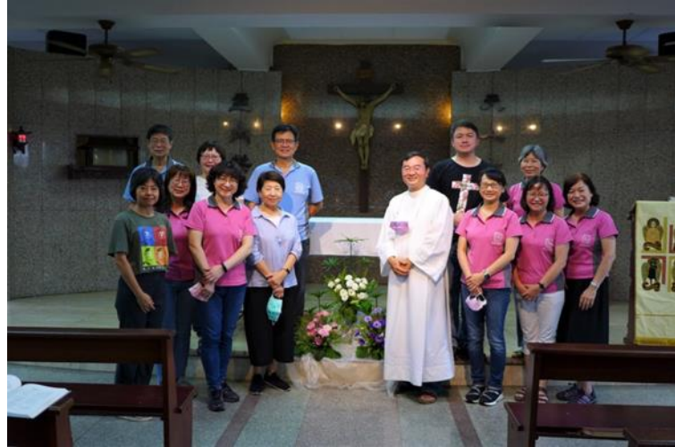
恩愛夫妻同心合一