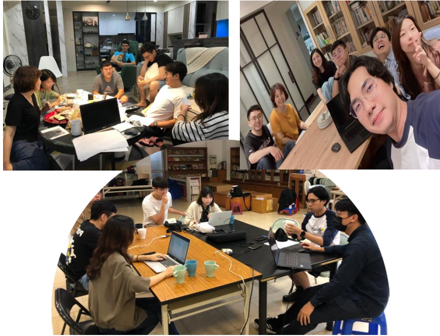
Y' ONLINE 團隊聚會實況

6月19日六月月會線上會議(Google Meet)。由伯陶導讀「眾位弟兄」通諭第四章及志弘分享預許之新天新地「昨日東職、今日聖母」。歡迎新朋友線上出席：李昀沄(紅瑋之女)、王雅恩(志弘之女)、鄭如君(聖母農莊志弘工作夥伴，領洗半年，靜宜大學社工系畢業，曾服務過生命探索營隊。)