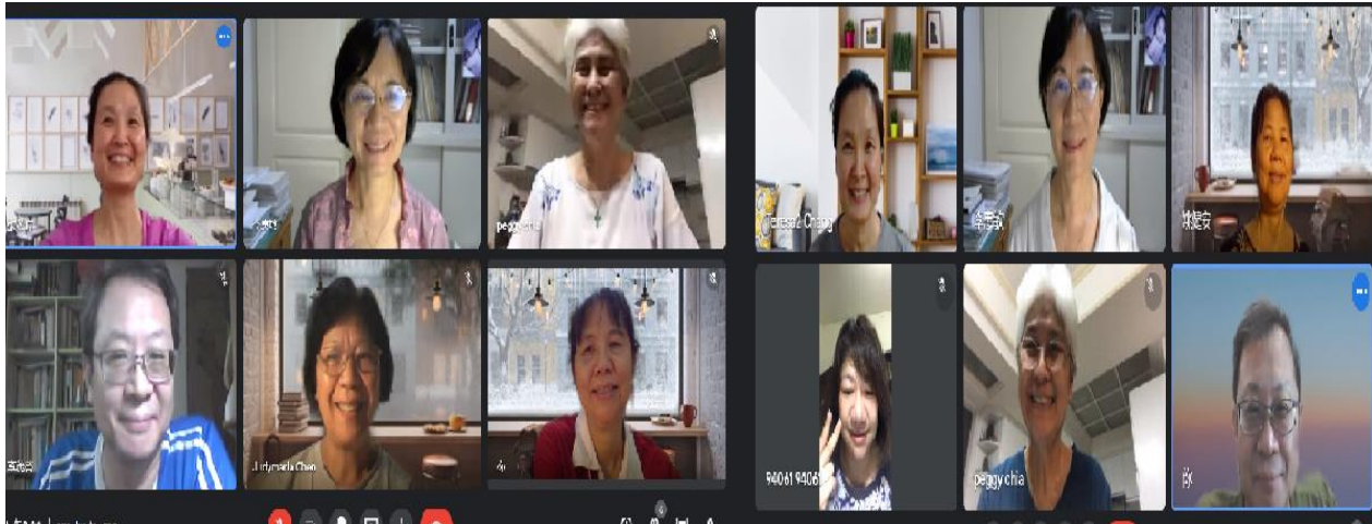
(註：第一組及第二組操練後，忘了拍照。故可惜未能一一分享呈現!)