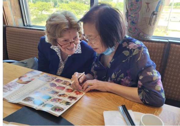
新梅與鄰居在中國城飲茶，慶祝鄰居 94 歲生日