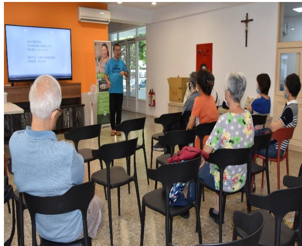
志弘解說聖母醫院和聖母農莊