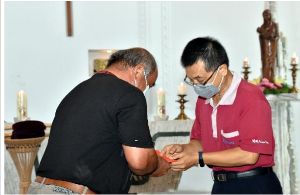
拜訪泰源天主堂，及參與主日彌撒