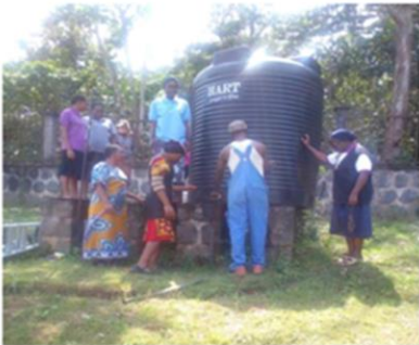
非洲喀麥隆修女院喜獲乾淨井水