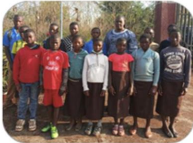
非洲喀麥隆學生獲仁愛助學金

Bi-annual newsletter celebrating the experience, the life and the joy of the CSCNA CHARITY CORPS