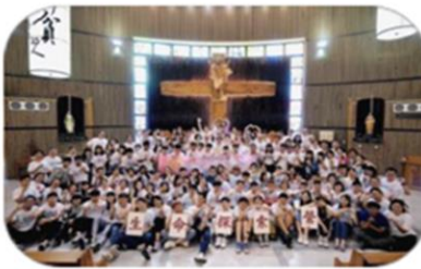
台灣 真福青年生命探索營