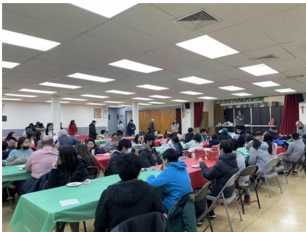
左：堂區聚會的大廳

每一次活動的結束，就我們這些大人跟唯一的一個學生“E生”一起離開。他的身影，是我們中最巨大的。