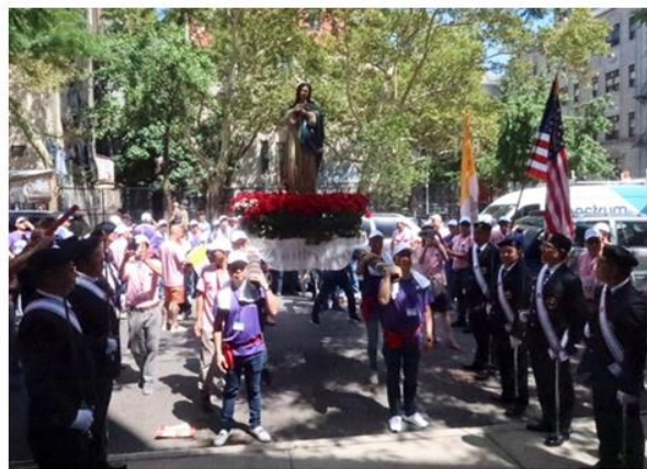
從教堂出發，有千人參與遊行……………遊行隊伍抵達社區另一教堂←