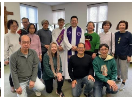
4/5-6/2025 在瑪利諾修女會院舉行年度避靜