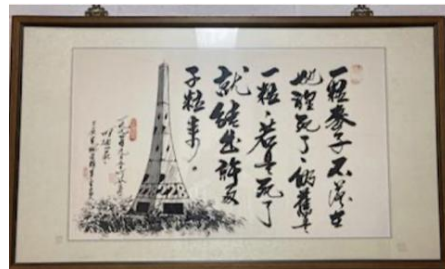
3/15-16/2024 在瑪利諾修女會院舉行（此畫展於瑪利諾修女院）