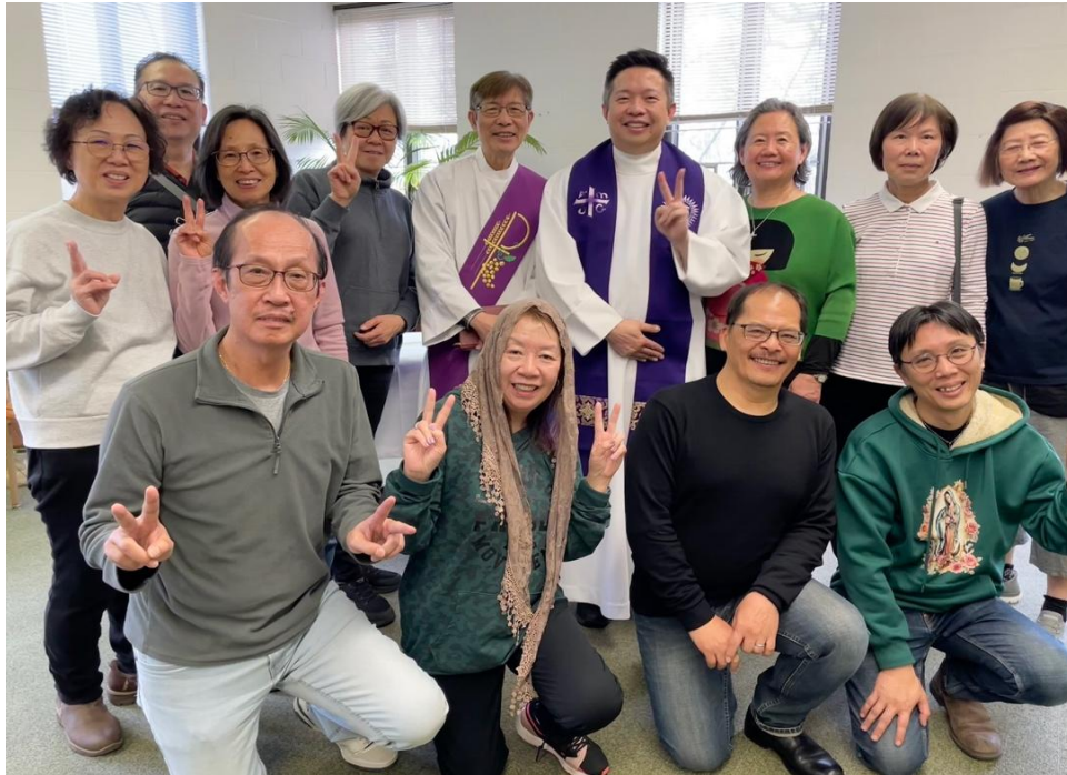
此次避靜 13 位同行的希望的朝聖者