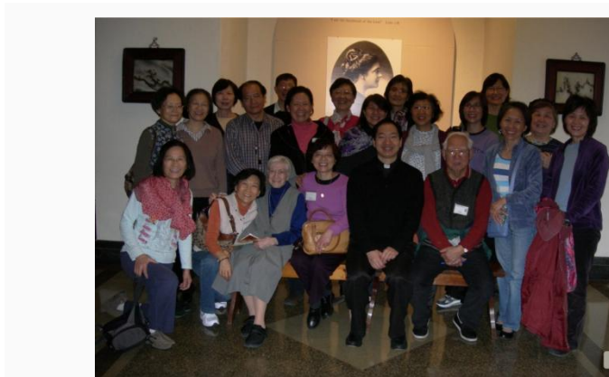
3/22/2013 at Maryknoll