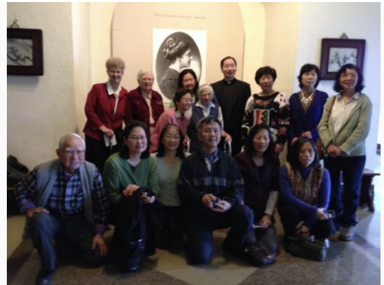
3/28/2014 at Maryknoll Sister