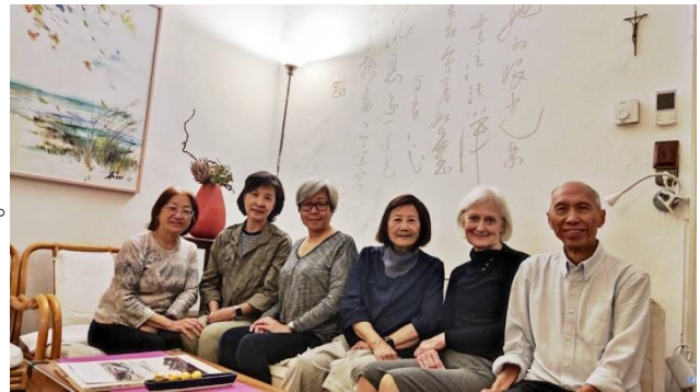
牆壁上就是寶林大哥寫給大女兒的詩

對家人的愛、對天主的愛是他的寶。她與寶嫂的相遇和結合堪稱浪漫，他外放剛毅，她內斂溫柔，天賜良緣。他為每位小孩寫一首詩，是他們名字的詠讚與期許。同時更是對天主的感謝。他出生在越南，越南赤化前，隻身被母親送到台灣，歷經過不知明天的麵包在何處的情況下，完成大學學業，又經過賈神父獎學金的推薦到瑞士進修。他陸續將家中兄弟姐妹拯救出赤化的越南，並將父母接至維也納奉養。