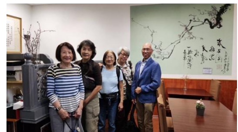
寶林大哥設計的一家中餐館