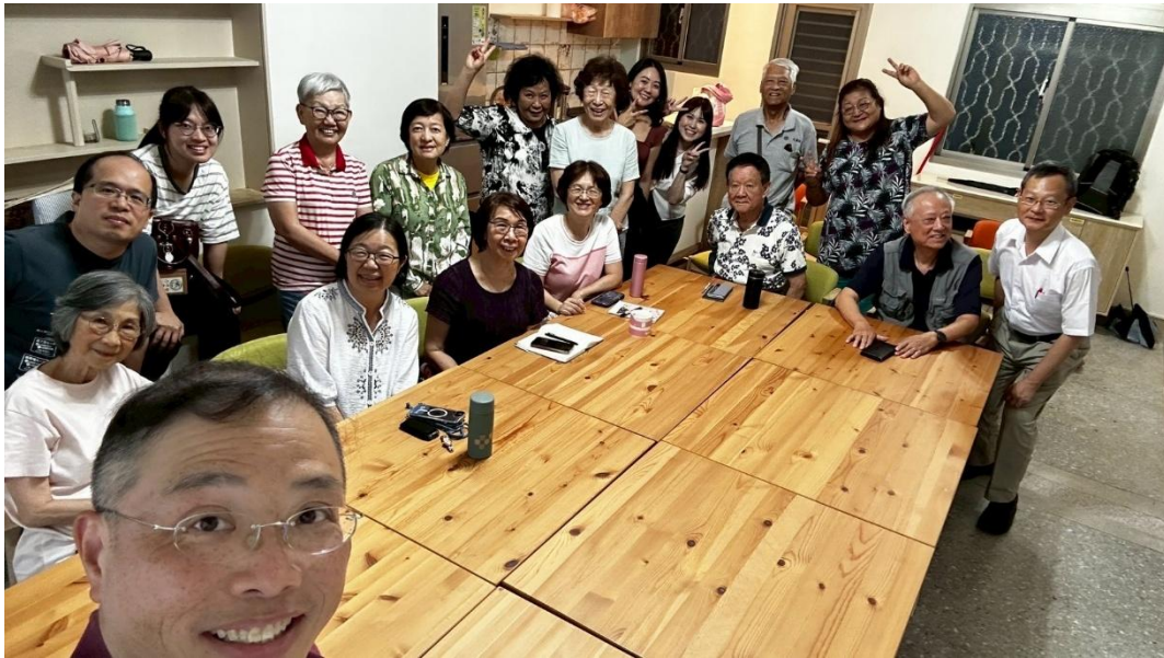
馮神父寫於分辨聖召朝聖之前 2009/6/17