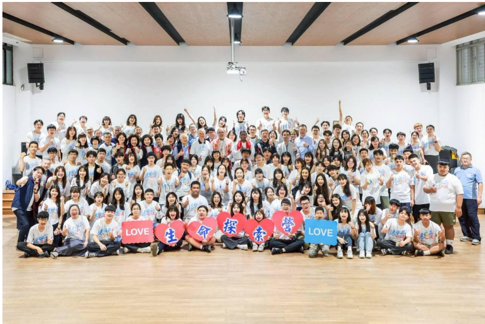
2026 生命探索營全體大合照